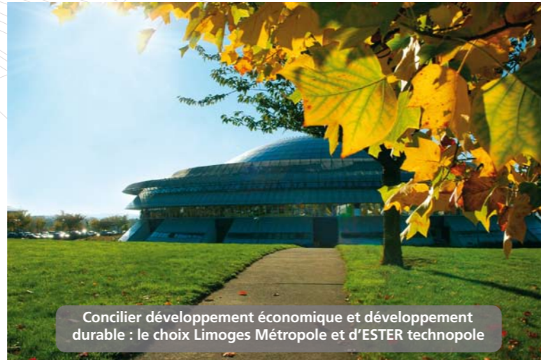
Concilier développement économique et développement durable : le choix Limoges Métropole et d'ESTER technopole

L'appartenance à plusieurs réseaux, de périmètre et de champs d'intervention différents, constitue un élément fort du positionnement d'ESTER, et lui permet de renforcer sa compétitivité.