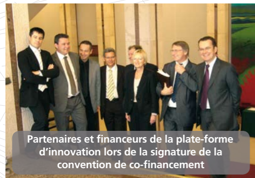
Partenaires et financeurs de la plate-forme d'innovation lors de la signature de la convention de co-financement

La plate-forme, dont l'objectif est d'accueillir et d'accompagner des projets et des entreprises innovants, sera un outil au service des industriels, des créateurs d'entreprises, et des laboratoires de recherche. Elle pourra mettre à leur disposition un parc mutualisé d'équipements de R&D et d'essais, voire des locaux industriels préinstallés, et des moyens humains pour faciliter la réalisation de projets et l'implantation de nouvelles activités innovantes. Ces projets seront focalisés sur la filière céramique et sur la filière électronique, optique et microonde. Actuellement en cours de réalisation, l'étude de création permettra de valider les thématiques et modes de fonctionnement du dispositif, de préciser les investissements nécessaires en matière d'équipements et d'infrastructures et de détailler la liste des services de soutien à mettre en œuvre.